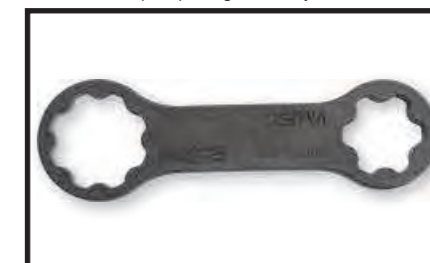
Sleutel voor de slipknop meegeleverd bij elke VM 150/ VM 275